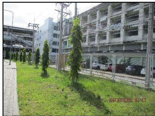
บริษัท ยูไนเต็ด แอนนาลิสต์ แอนด์ เอ็นจิเนียริง คอนซัลแตนท์ จำกัด ห้องปฏิบัติการทดสอบมาตรฐาน ISO/IEC 17025:2017 by TSI and DSS ได้รับการรับรอง ISO 9001:2015 และ ISO 14001:2015 จากสถาบันมาตรฐานอังกฤษ