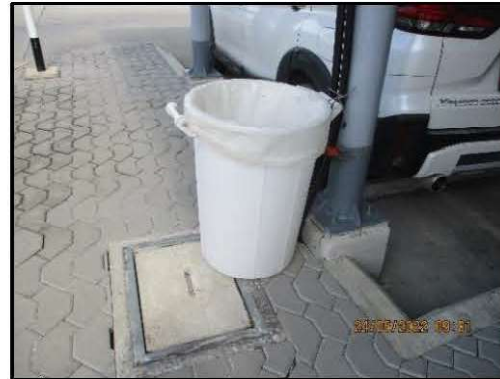
รูปที่ 2-7 ถังรองรับขยะมูลฝอยบริเวณลานจอดรถ