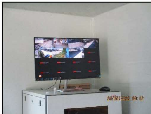
รูปที่ 2-10 โทรศัพท์วงจรปิดบริเวณทางเดินเข้า-ออกลานจอดรถ