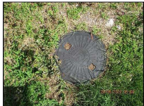
รูปที่ 2-6 ระบบบำบัดน้ำเสียของโครงการ