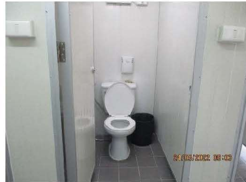
รูปที่ 2-5 ห้องสุขา