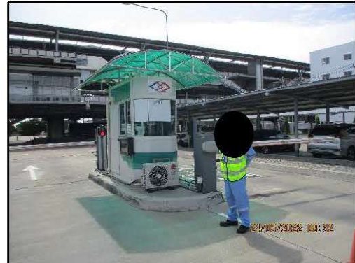
รูปที่ 2-4 เจ้าหน้าที่รักษาความปลอดภัยประจำลานจอดรถ