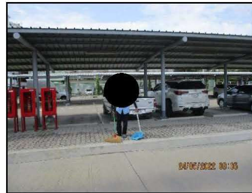
รูปที่ 2-8 เจ้าหน้าที่ทำความสะอาด