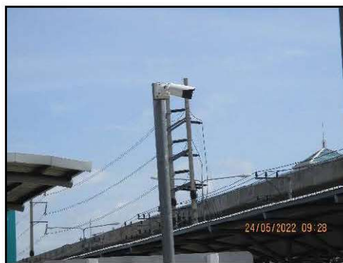
รูปที่ 2-9 โทรศัพท์วงจรปิดภายในพื้นที่ลานจอดรถ